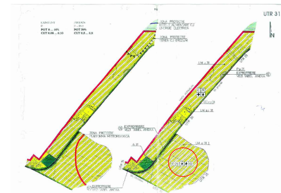
INVENTAR DE COORDONATE Sistem de proiectie: stereografic 1970